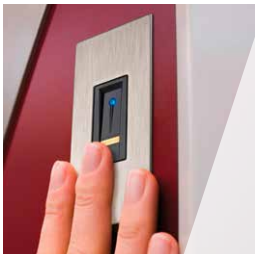
Fingerprint, Scanner und Steuereinheit