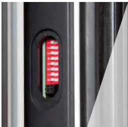
Wartungsarm/ einfache Programmierung