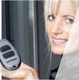
Öffnen und schliessen per Handsender