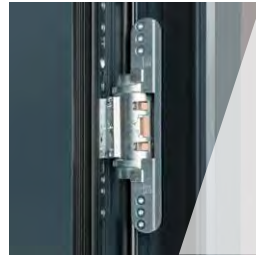
Hohe Sicherheit durch BAYERWALD® Tresorband